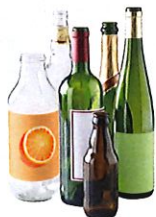
Bouteilles et cannettes en verre