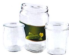
Pots et bocaux (confiture, pâte à tartiner, fruits et légumes...)