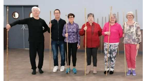
Qi Gong du bâton