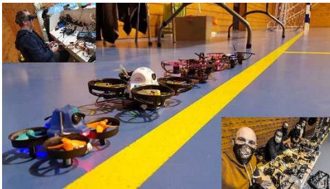
Aéromodélisme en salle