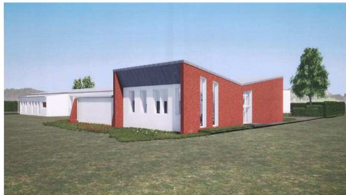
Vue arrière avec l'extension coté Terrain de Football