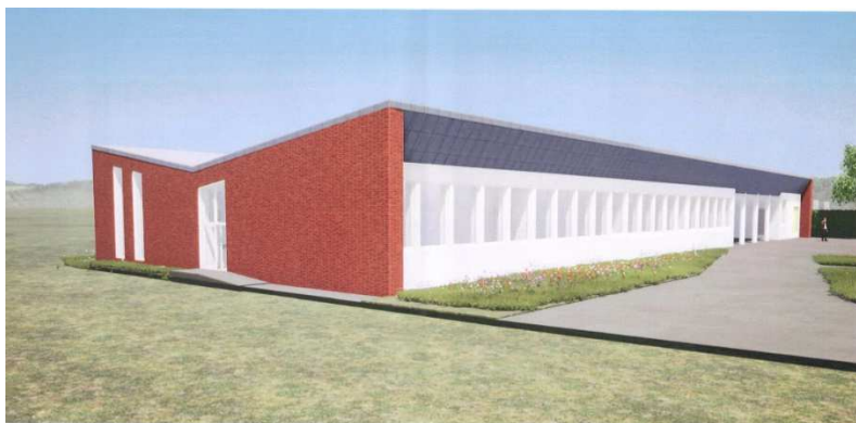
Vue du bâtiment rénové – entrée de l'école

Un marché public de travaux lesquels ont été répartis en 10 lots a été lancé et attribué lors du dernier conseil municipal. Le montant total de ces travaux s'élève à 572 470,09 € HT. Des financements du Département du Pas-de-Calais via le FARDA sont attendus à hauteur de 87 500 € et de l'Etat via la DETR et la DSIL à hauteur de 48 500 € et 145 650 € soit un montant total de financement de 281 700 €, le reste étant autofinancé par la commune. Ces travaux auront lieu cet été.