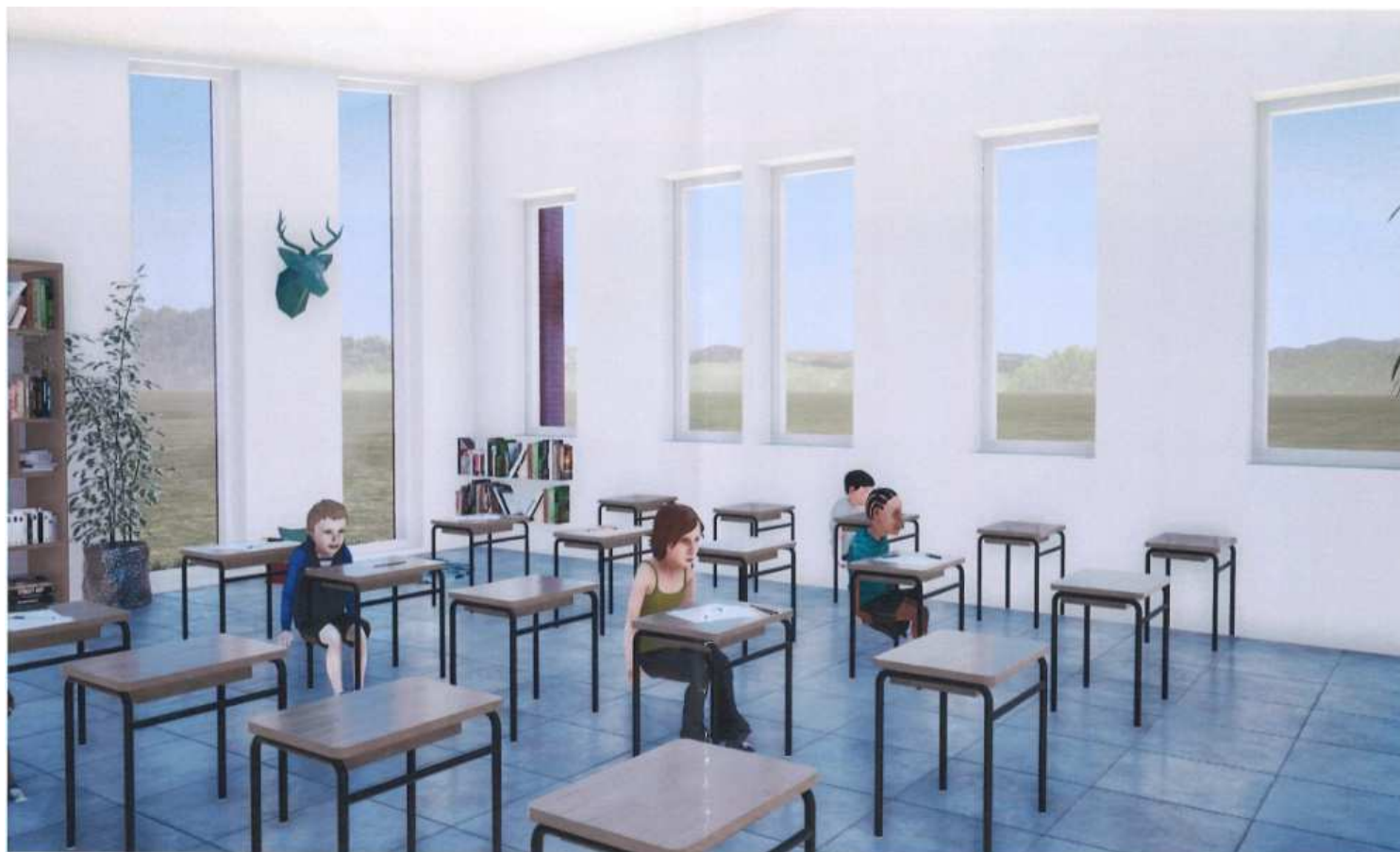
Esquisse de l'extension dans le bâtiment principal – Classe de CP