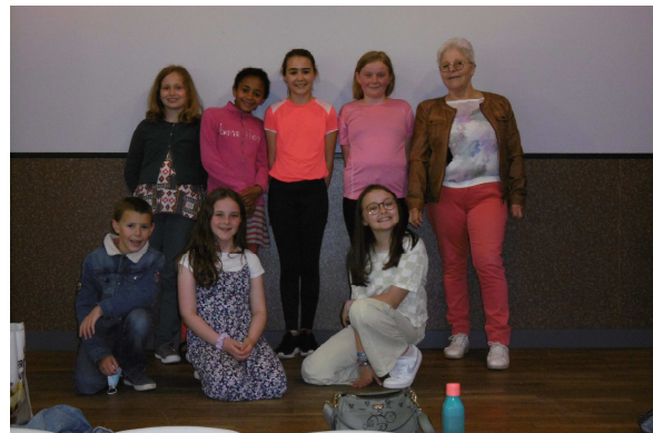
Section Théâtre de l'Omnisports